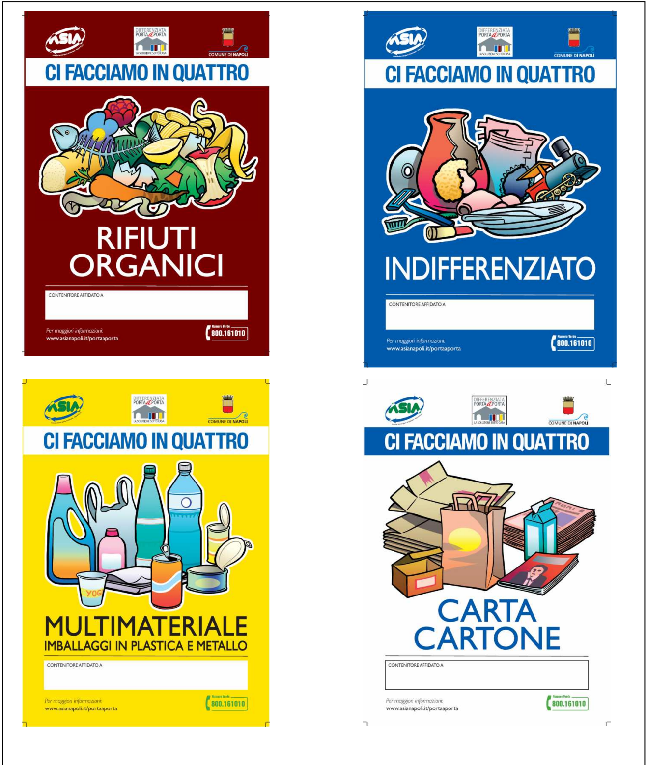
Figura 4. Progettazione grafica adesivi per i contenitori utenze domestiche

Sono inoltre stati definiti il formato, l'aspetto grafico e i contenuti degli adesivi da apporre sui singoli contenitori, che si allegano nelle figure seguenti.