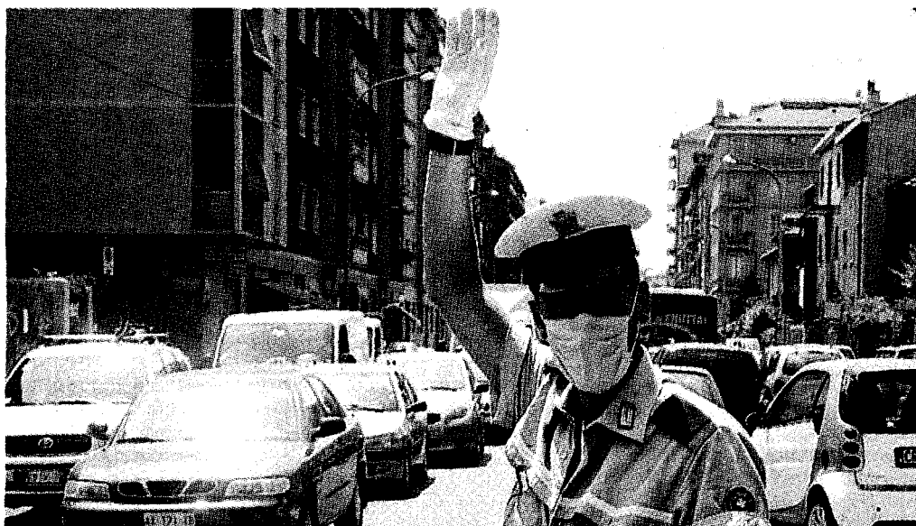
Da dieci giorni le polveri sottili sono stabilmente sopra i 50 mg, limite previsto dalla legge