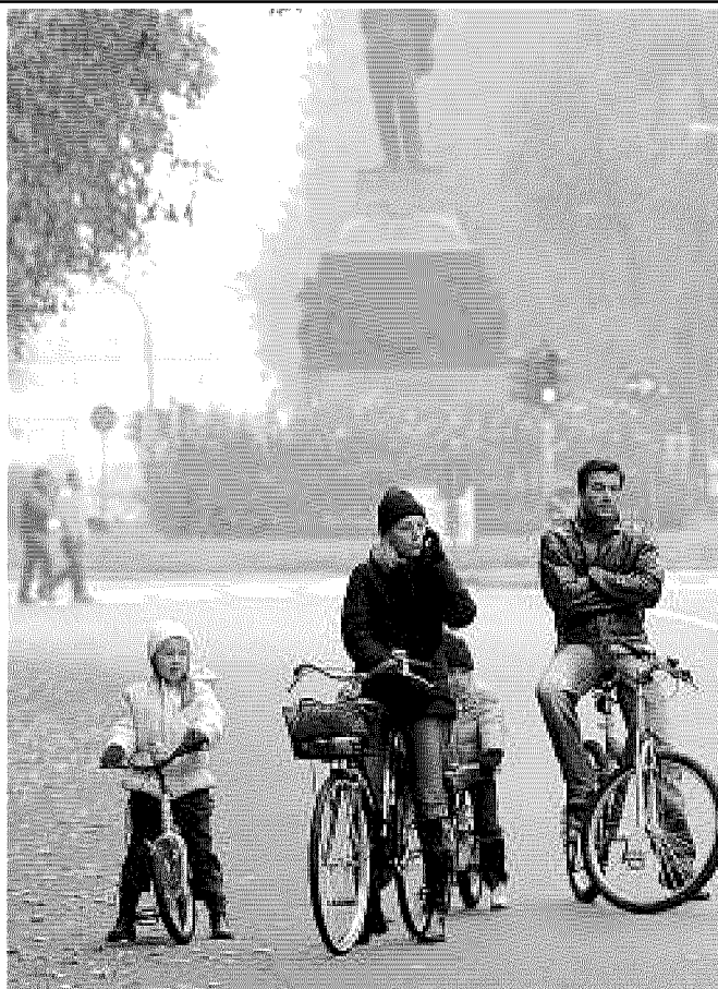
Torna domenica la giornata senz'auto