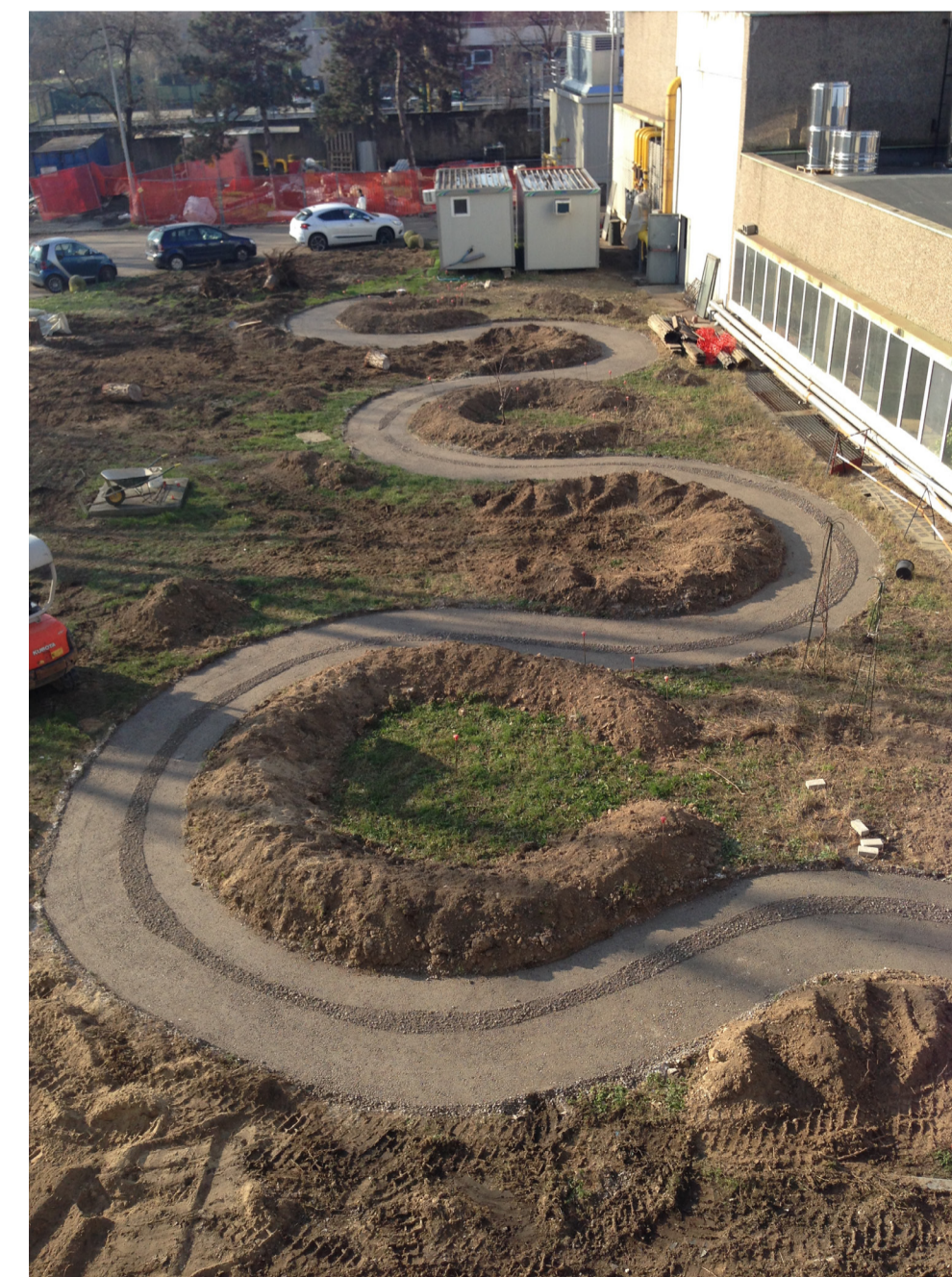
foto - LAVORI IN CORSO ... il GIARDINO E L'ORTO SINERGICO

Abbraccio Bianco Colori chiari e profumati che trasmettono un senso di purezza e pace