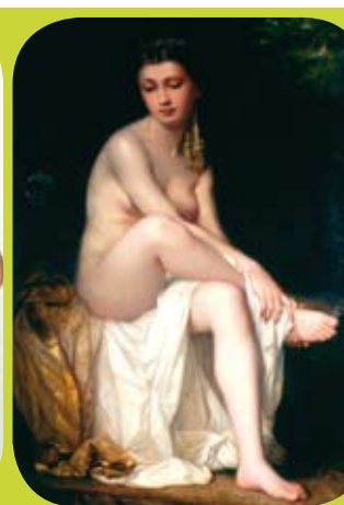
Charles Z. Landelle, Suzanne au bain, XIXème