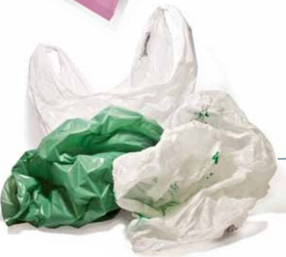
Sacchetti shopper NON BIODEGRADABILI NON COMPOSTABILI