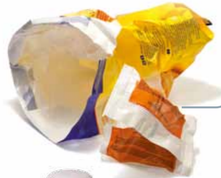
Sacchetti merendine ALLUMINIO ESCLUSO