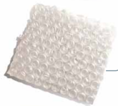
Imballi vari ed eventuali SCOPPIETTANTI O STRAPAZZATI