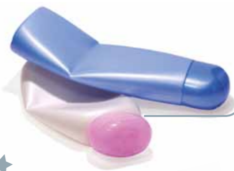
Shampoo per tutti i capelli SENZA BOLLE