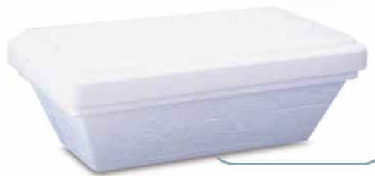
Vaschetta polistirolo MILLE GUSTI