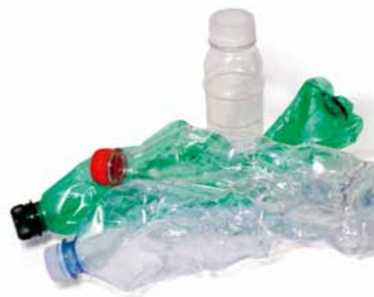
Bottiglie belle vuote SCHIACCIATE E FINO ALL'ULTIMA GOCCIA