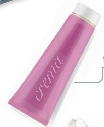
Crema tubetti SPREMUTI A DOVERE