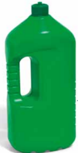
Detersivo piatti o bucato SENZA OLIO DI GOMITO