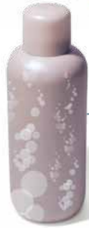
Bagnoschiuma per grandi e piccini RISCIACQUATO RESPONSABILMENTE