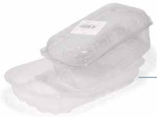
Contenitori alimentari e non COPERCHIO INCLUSO