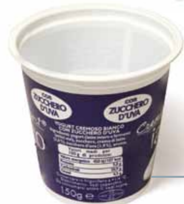
Vasetti senza coperchio SCIACQUATI E RISCIACQUATI