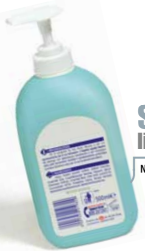
Sapone liquido NON SOLO DI MARSIGLIA