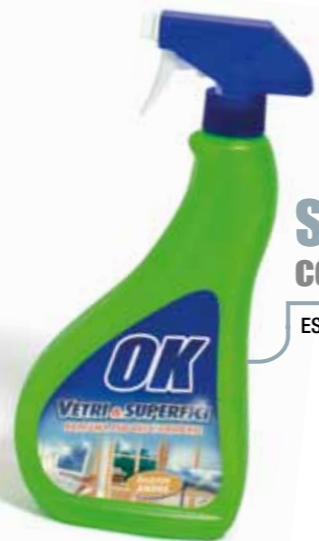
Sgrassatore con spruzzino ESAUSTO E SFINITO