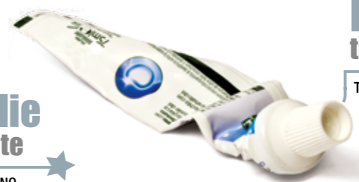
Dentifricio tubetti TAPPO COMPRESO